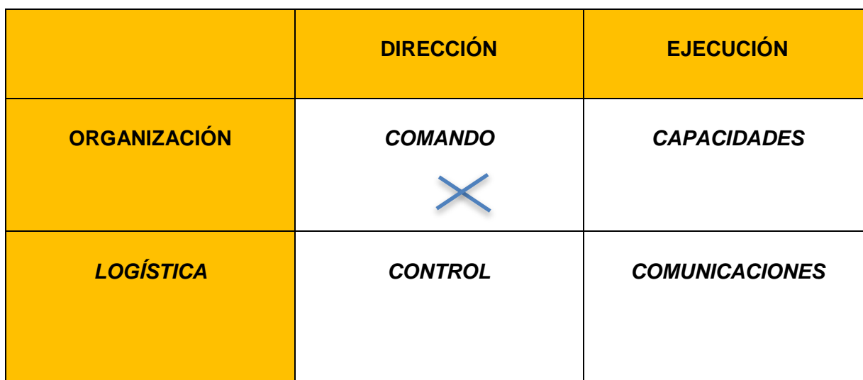
Cuadro 16 Estrategia C

¿Cuáles son los componentes de la estrategia?