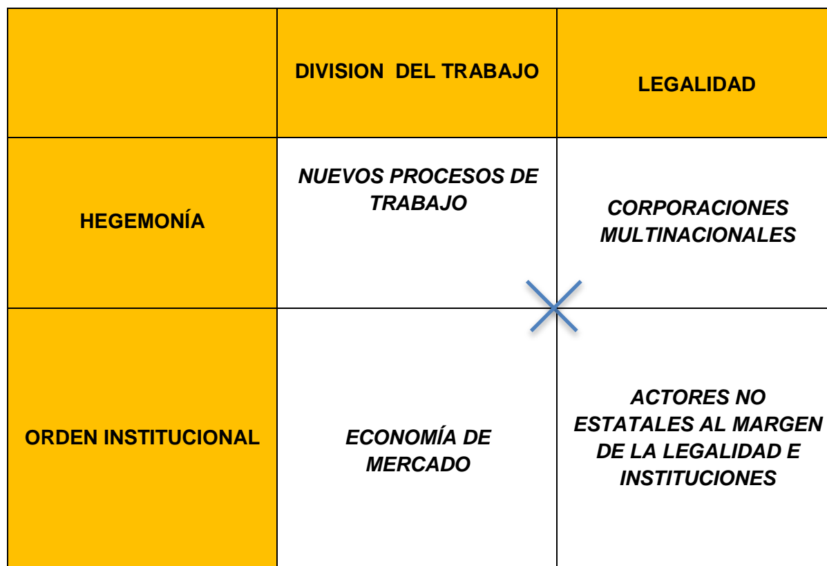
Cuadro 5.- Emergencia de actores no estatales