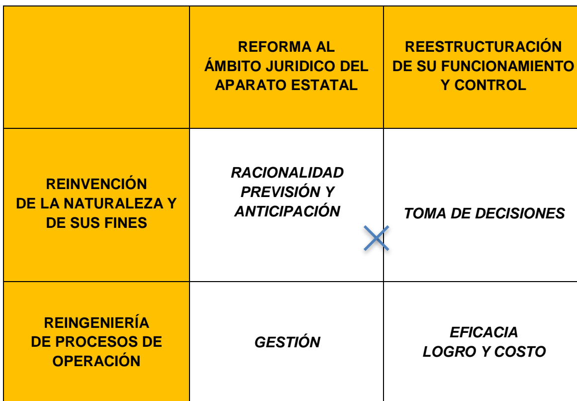
Cuadro 9 El nuevo estado para el siglo XXI.

¿Bajo qué premisas se estructurará el nuevo Estado del siglo XXI?